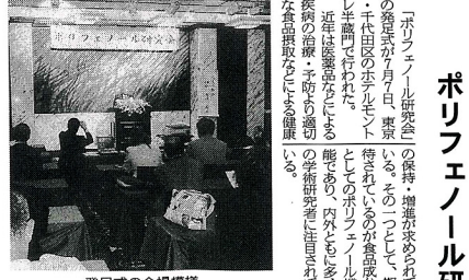
発足式の会場模様

ポリフェノール研究会の発足式。この研究会は、ポリフェノールの健康効果を研究し、信頼できるデータを提供することを目的として発足した。研究会の発足式には、関係者から多くの参加者が集まり、今後の研究活動について話し合った。